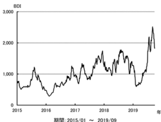
不定期船市況 BDI の推移