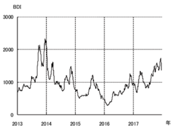
不定期船市況 BDI の推移

以上の結果、不定期専用船事業全体で業績は改善し、前年同四半期比増収となり利益を計上しました。