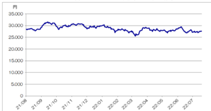
<NEXT FUNDS 日経225連動型上場投信の終値の推移>

(注)ただし、2022年7月は7月19日まで。2022年7月19日の東京証券取引所におけるNEXT FUNDS 日経225連動型上場投信の終値は27,610.0円であった。