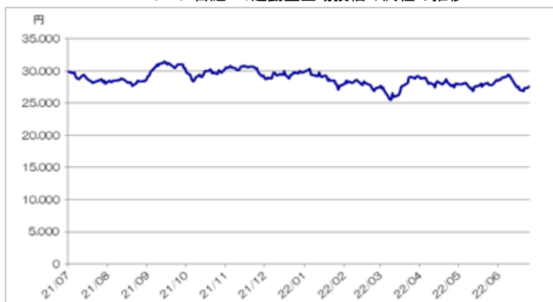
<NEXT FUNDS 日経225連動型上場投信の終値の推移>

(注)ただし、2022年6月は6月24日まで。2022年6月24日の東京証券取引所におけるNEXT FUNDS 日経225連動型上場投信の終値は27,605.0円であった。