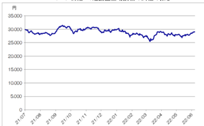
<NEXT FUNDS 日経225連動型上場投信の終値の推移>

(注)ただし、2022年6月は6月6日まで。2022年6月6日の東京証券取引所におけるNEXT FUNDS 日経225連動型上場投信の終値は29,100.0円であった。