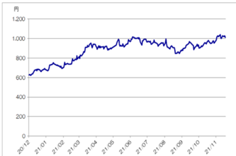
< 丸紅株式会社の終値の推移 >

(注)ただし、2021年11月は11月17日まで。2021年11月17日の東京証券取引所における丸紅株式会社の株価終値は1,011.0円であった。