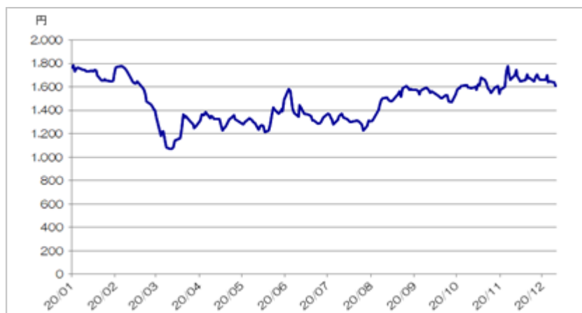
< 第一生命ホールディングス株式会社の終値の推移 >

(注)ただし、2020年12月は12月15日まで。2020年12月15日の東京証券取引所における第一生命ホールディングス株式会社の株価終値は1,605.0円であった。