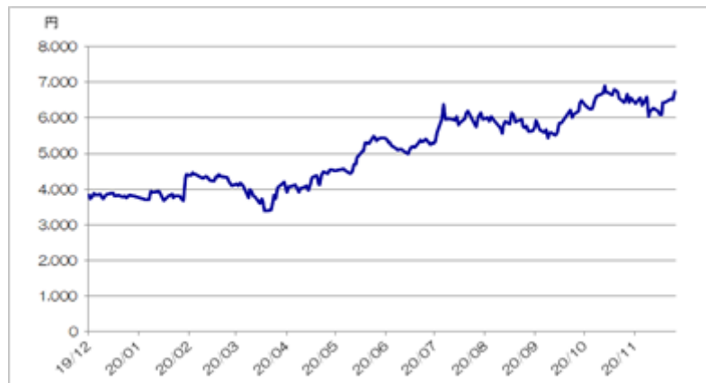
&lt;株式会社サイバーエージェントの終値の推移&gt;