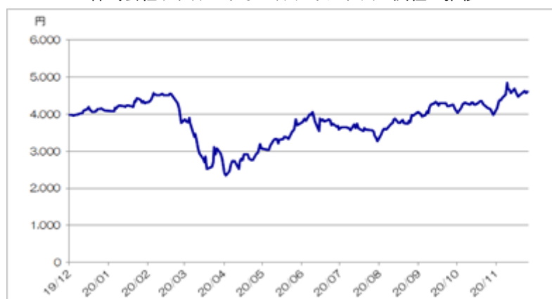
&lt;株式会社リクルートホールディングスの終値の推移&gt;

(注)ただし、2020年11月は11月26日まで。2020年11月26日の東京証券取引所における株式会社リクルートホールディングスの株価終値は4,600.00円であった。