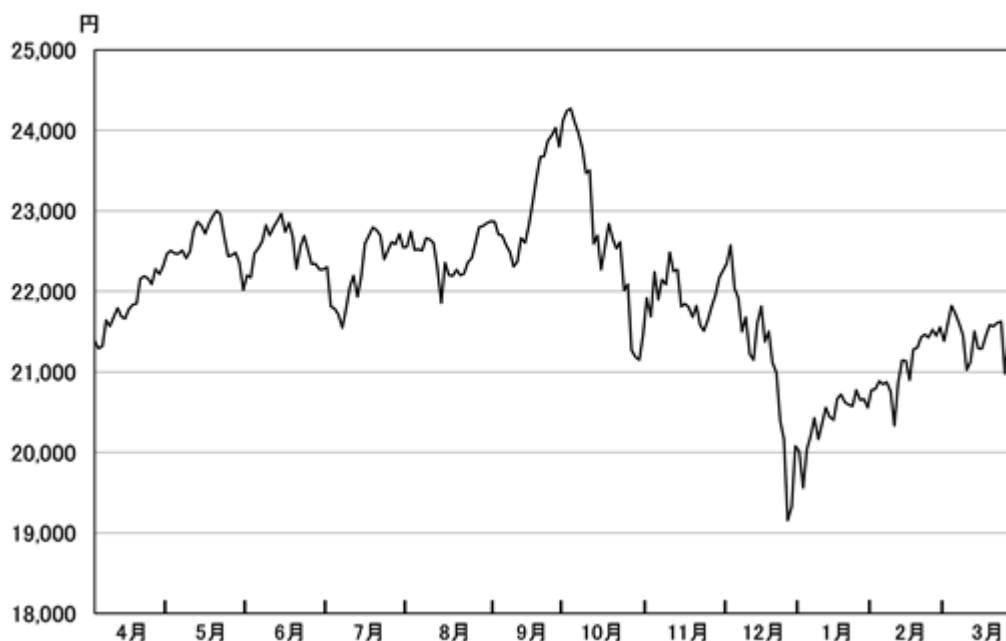
2019年3月期累計期間の日経平均株価(終値)の推移

こうした環境のもと、国内株式市場は、期初より上昇し、5月21日の日経平均株価（終値）は、およそ3ヶ月半ぶりに23,000円台を回復しました。その後、9月上旬までは、米中貿易摩擦の動向を睨み、膠着した状態が続いたものの、9月中旬になると、米中両政府が閣僚級協議を再開する可能性が浮上したことや、円安ドル高の進行を好感して上昇し、10月2日の日経平均株価（終値）は24,270円62銭と、およそ27年ぶりの高値となりました。しかし、その後は、米国の金利上昇や中国景気の減速懸念を背景とした世界的な株安傾向から、日経平均株価（終値）も21,000円台前半まで下落しました。11月には、米国の中間選挙の結果を受けて反発する場面も見られましたが、12月に入ると、米中貿易摩擦への警戒感に加え、FRB（米国連邦準備制度理事会）の利上げ姿勢を嫌気して株価は急落し、12月25日の日経平均株価（終値）は、19,155円74銭（期中の安値）となりました。その後、パウエルFRB議長が今後の利上げに慎重な姿勢を示したことや米中貿易協議の進展期待などから、株価は回復基調を辿りましたが、3月には、中国、欧州の景気悪化懸念や英国のEU離脱を巡る協議の難航から様子見姿勢が強まり、3月末の日経平均株価（終値）は21,205円81銭と前期末（21,454円30銭）を1.2%下回る水準で取引を終了しました。