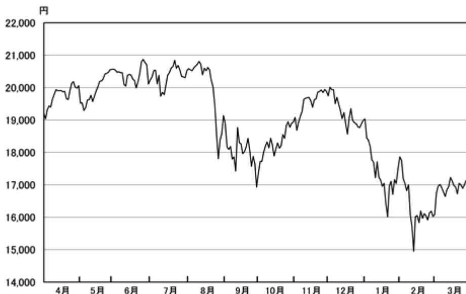
平成28年3月期累計期間の日経平均株価（終値）の推移

国内株式市場は、良好な企業業績や円安の進行を背景に、期初より上昇基調となり、6月24日の日経平均株価（終値）は20,868円03銭とITバブル期に付けた高値（平成12年4月12日：20,833円21銭）を上回りました。8月上旬までは、概ね20,000円を上回る水準で堅調に推移しましたが、8月中旬になると、中国経済の減速を端緒とした世界的な株安を背景に急落し、9月29日に17,000円を割り込みました。10月からは、世界的な金融緩和継続の流れを好感して上昇に転じ、日経平均株価（終値）は12月1日に20,000円を回復しました。しかし、その後は、原油価格の下落に加え、中国経済の減速懸念や急速な円高の進行、欧州大手銀行の信用不安など複数のリスク要因が共振したことから大幅な調整を余儀なくされ、2月12日には終値で15,000円を割り込みました。2月中旬以降は、円高や原油価格の下落が一服したことから過度の不安心理が後退し、戻り歩調となりましたが、3月31日の日経平均株価（終値）は16,758円67銭と、前年度末（19,206円99銭）を12.7%下回る水準で取引を終了しました。