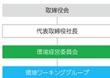
ガバナンス体制図

当社グループでは、気候変動問題を含む環境問題全般についての基本方針等の重要事項は、取締役会で審議のうえ決議されることとしています。特に、グループ横断的な環境問題への対応につきましては、代表取締役社長を委員長とし、企画・管理・事業・技術開発の各本部長を委員とする「環境経営委員会」で審議・検討され、最終的に取締役会に上程される体制としています。環境経営の進捗状況や環境課題に係る事業のリスクと成長機会は、毎年取締役会に報告、レビューされます。