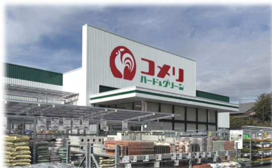
3月19日 新規出店 コメリハード&グリーン 戸塚下郷店 (神奈川県)