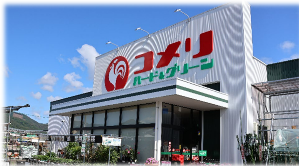
3月 スクラップ&ビルド コメリハード&グリーン一迫店 コメリハード&グリーン岩舟店

建設費高騰の影響 ⇒ 建物仕様の見直し ⇒ 来期繰越し物件発生 パワーへの業態転換も推進 ⇒ 第4Qで5店舗実施 150坪H&GのS&B ⇒ 既存商圈の盤石化