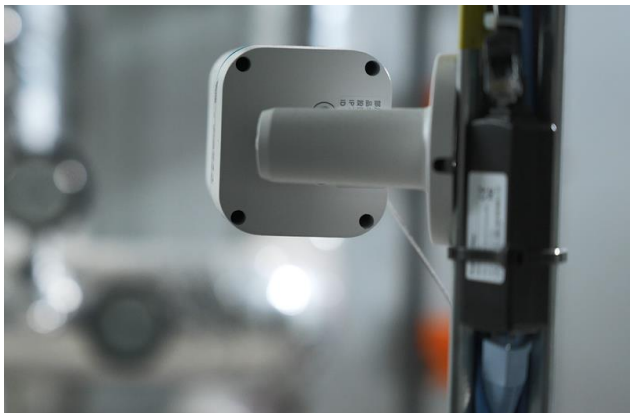
●カメラ（上）やセンサー（下）の活用により施設管理業務をDX