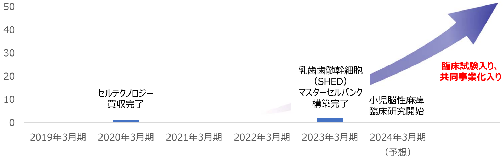
再生医療事業売上高（億円）