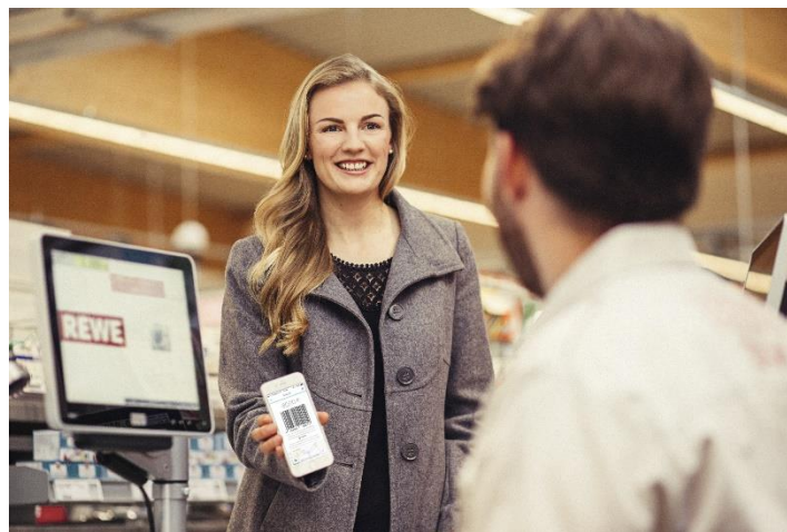
キャッシュ・アクセス・プラットフォーム