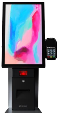
セルフサービス キオスク