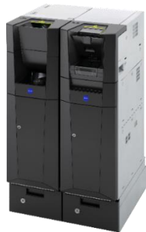
紙幣・硬貨 入出金機