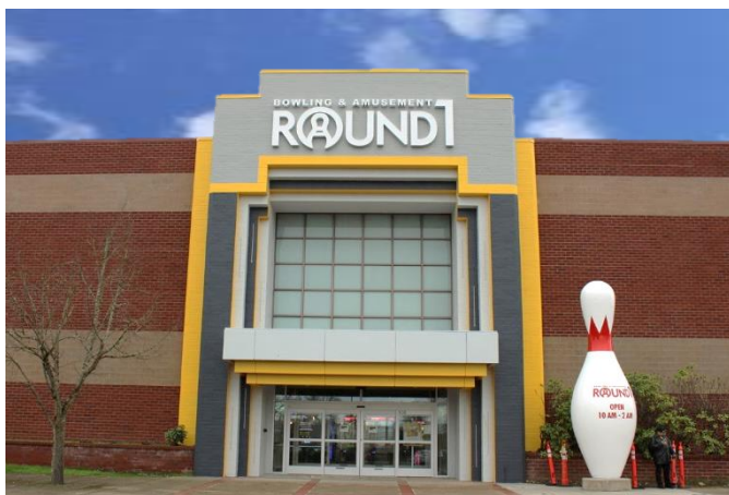
ラウンドワン バレーリバーセンター店 米国 オレゴン州ユージーン 2020年2月15日オープン！