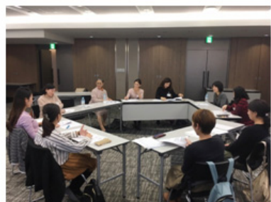
仕事と育児の両立支援セミナー 女性社外取締役との座談会

会社敷地内禁煙や全社員を対象としたストレスチェック等、健康経営に向けた取り組みを実行