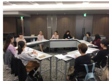
仕事と育児の両立支援セミナー 女性社外取締役との座談会

会社敷地内禁煙や全社員を対象としたストレスチェック等、健康経営に向けた取り組みを実行