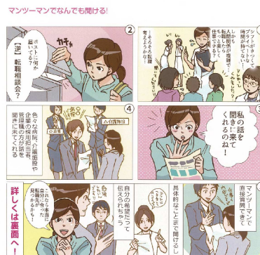
(マンガを使った法人案内リーフレットと広告)