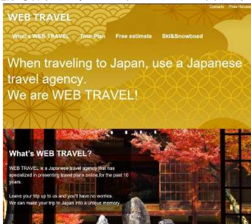
（ウェブトラベルのインバウンド用ウェブサイト）

訪日外国人向けのインバウンドサイトでは、アジアを中心とした検索エンジン対策を実施して、さらなる旅行サービスを展開してまいりました。今期も引き続き、ウェブトラベルのイメージ動画をサイト内に配置し、安心度を高める施策も行うなど、インバウンドサイトの更なる充実を図ってまいります。