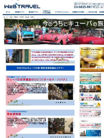
（こだわる人の旅「今のうちにキューバの旅」）

グロリアツアーズでは、障がい者スポーツの選手団派遣や国際大会関連の渡航を中心に取り扱っております。障がい者スポーツは、2020年東京オリンピック・パラリンピックに向けて年々関心が高まっており、今後も一層力を入れてまいります。