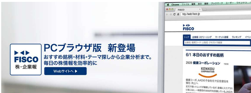
FISCOウェブ ( https://web.fisco.jp/ )

さらに、「農業ICT」に関しましては当社の農業ビジネス拡大に伴い機能拡充のバージョンアップなどを行っております。