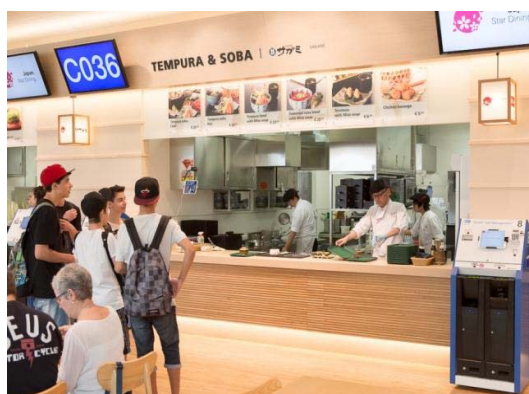
5月1日から10月31日まで ミラノ万博日本館に出店いたしました