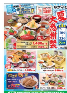
『夏の大感謝祭』の折込チラシ