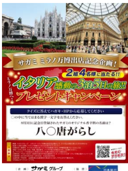
5月に実施した ミラノ万博出店記念企画ポスター