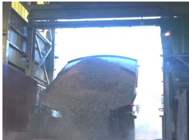
一次クラッシャー投入の様子