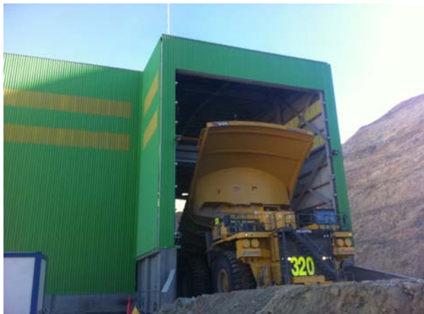
一次クラッシャー建屋