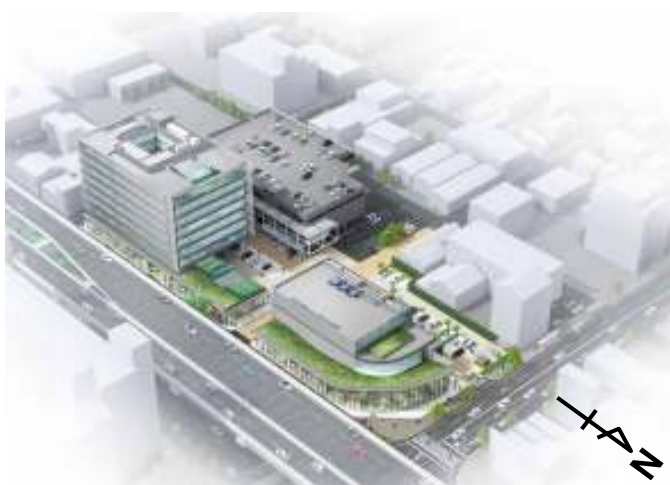
再開発エリア全体の鳥瞰図(イメージ)

※「CASBEE・名古屋」(建築環境総合評価システム)の総合評価Aランク以上の取得を竣工後に予定