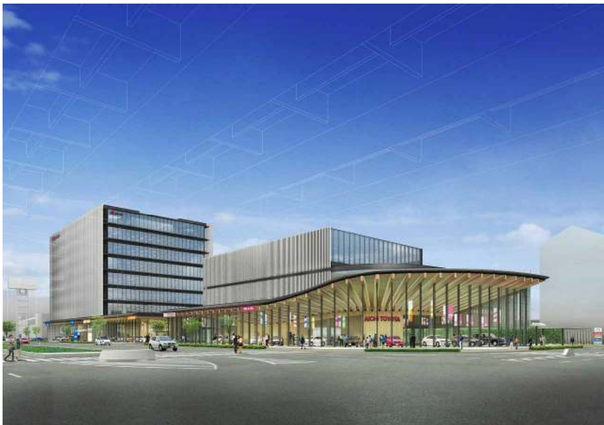
完成予想図(高辻交差点から南西方向のイメージ)

当社は、平成25年2月12日に「本社地区再開発計画」を再開することを発表し、平成25年5月10日および平成25年8月8日の決算発表時に、同日時点までの進捗を報告させていただき現在に至っております。このほど、建物全体の計画がほぼまとまりましたのでお知らせいたします。