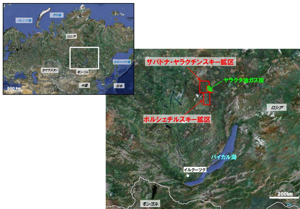
<鉱区ロケーション>

国際石油開発帝石株式会社（以下、当社）は、ロシア連邦イルクーツク州のザパドナ・ヤラクチンスキー鉱区（以下、ZY 鉱区）およびボルシェチルスキー鉱区（以下、BT 鉱区）で探鉱事業を推進している日本南サハ石油株式会社（独立行政法人石油天然ガス・金属鉱物資源機構（JOGMEC）100%出資会社。以下、JASSOC）の株式の売却について、JOGMEC が実施した入札に伊藤忠商事株式会社（以下、伊藤忠）とともに参加し、JASSOC の発行済株式の一部（発行済全株式 340 株の内、当社 42 株（12.4%）、伊藤忠 43 株（12.6%））をそれぞれ取得しましたので、お知らせいたします。